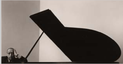
Igor Stravinsky, New York 1946