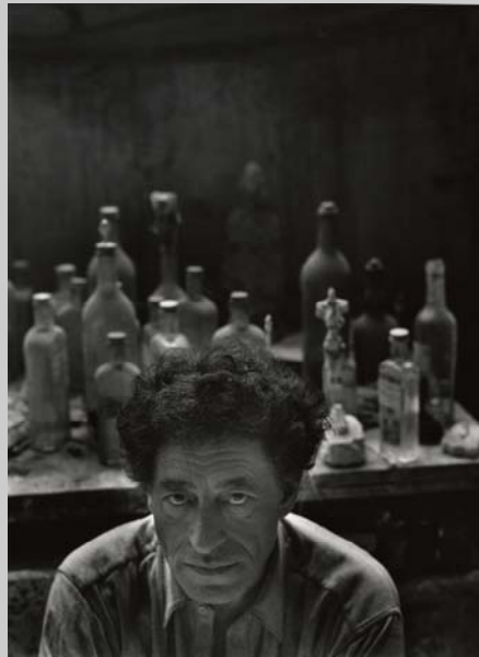
Arnold Newman Alberto Giacometti, Paris 1954

Texte / Bilder dürfen nur im Zusammenhang mit einem Artikel über die Ausstellung verwendet werden. Die Bilder dürfen nur in Originalform publiziert werden (keine Ausschnitte, Übersreibungen, usw.).