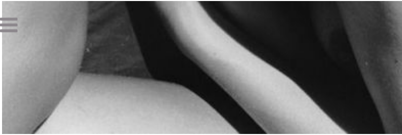
Ernestine Ruben Protect me, 1983 Platinum-palladium print Artef Galerie für Kunstfotografie

Over 140 leading galleries from 33 countries will be featured this year at the Grand Palais, presenting both historical and contemporary works. Joining them are 27 publishers and specialized art book dealers providing a complete panorama of the photographic medium.