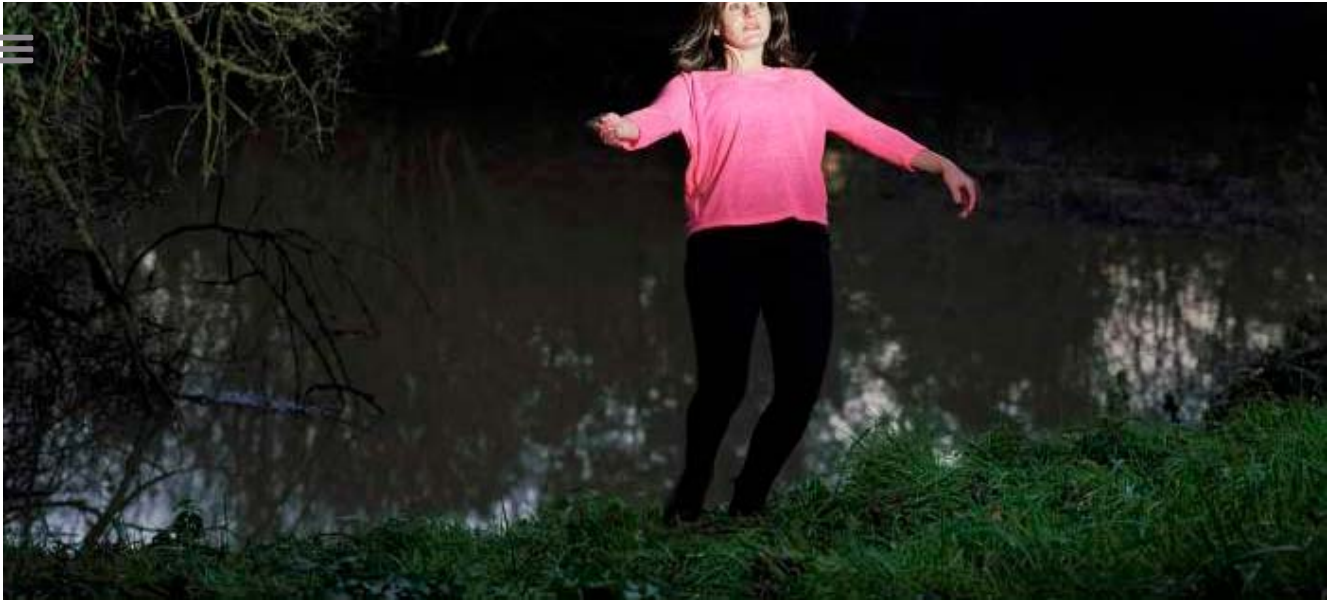
Natasha Caruana, Alchimie du Soleil, Résidence BMW 2014

Sin duda una de las semanas más esperadas de los amantes de la fotografía, coleccionistas, profesionales de la fotografía, artistas, amateurs y público en general que disfruta de la fotografía.