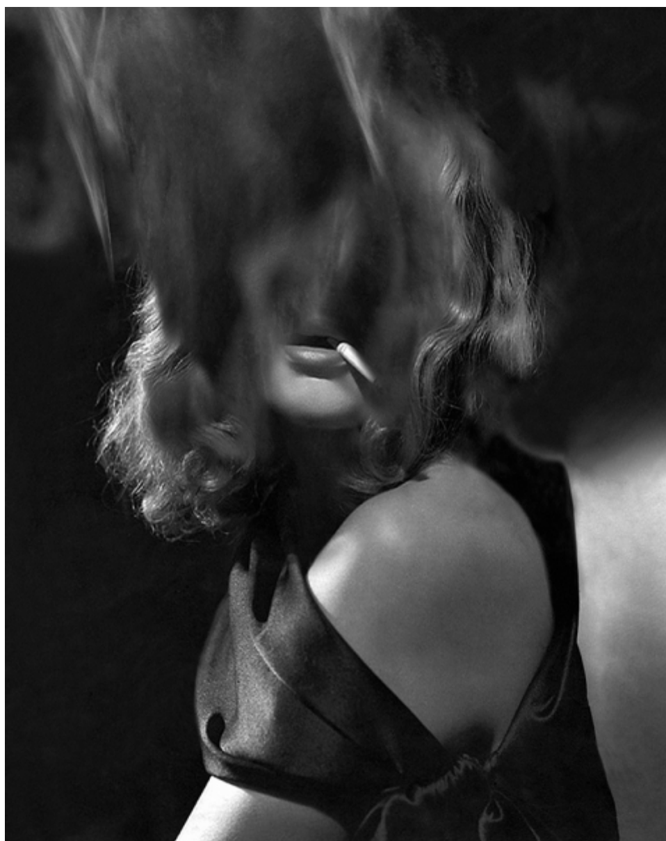
Noé Sendas Crystal Girl n° 84, 2014 B/W inkjet print(pigmented inks) on luster paper

Por primera vez, este año, varias galerías presentarán obra en grandes formatos así como series de fotografías en una nueva sección en el Salon d´Honneur. Este mismo salón también albergará al coleccionista invitado, Enea Righi, quien presentará obras de las colecciones privadas más importantes de Italia con artistas como Cy Twombly, Nan Goldin, y Hans-Peter Feldmann, entre otros.